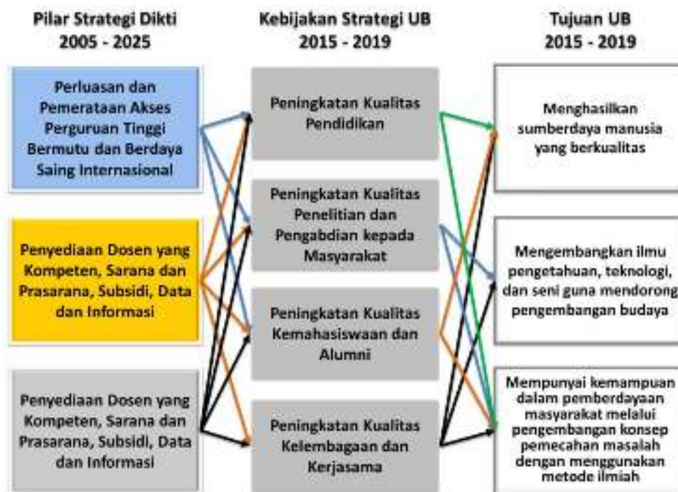
Gambar 2. Keterkaitan Kebijakan Strategis dan Tujuan Universitas Brawijaya dengan Pilar Strategi Dikti